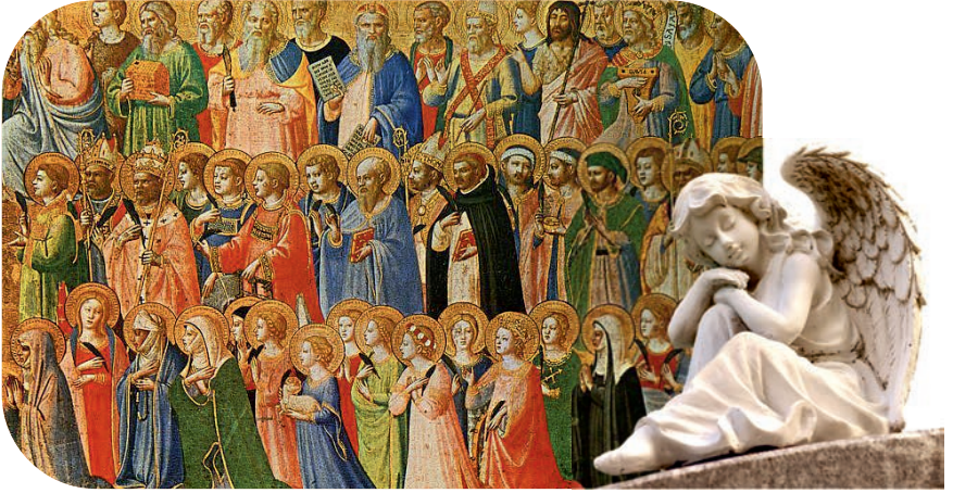
സകലവിശുദ്ധരുടെയും തിരുനാൾ നവംബർ 01