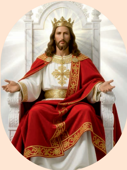
ക്രിസ്തുരാജ്യ തിരുനാൾ നവംബർ 23